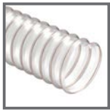
VULCANO® 09 AF