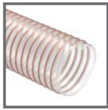
VULCANO® 09 EST