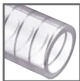
PLUTONE A SE