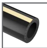
ARIANNA 20 BAR