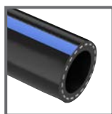
ARIANNA 40 BAR