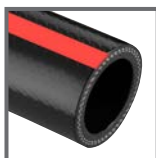
ARIANNA 80 BAR