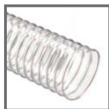
VULCANO® R FR