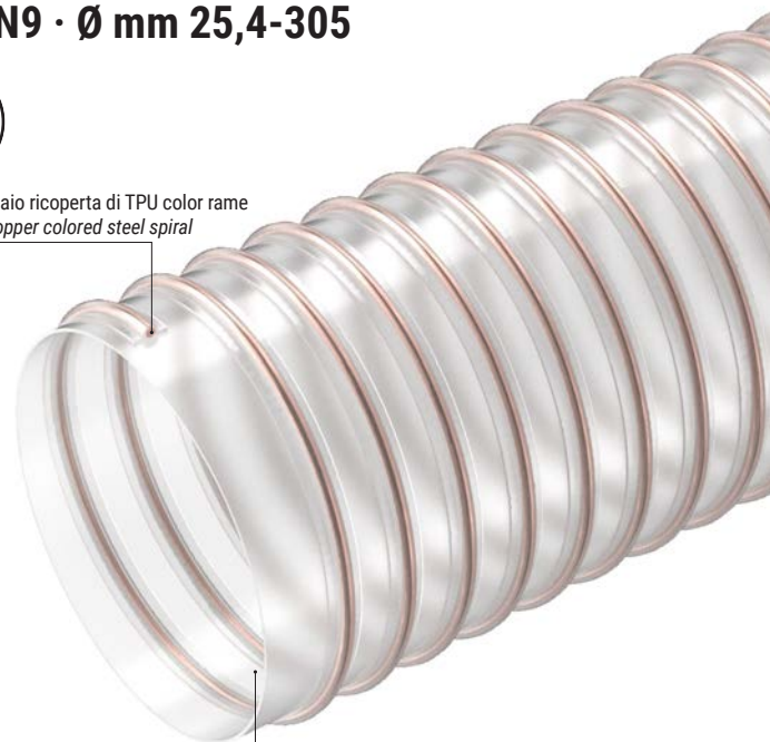
TPU a base estere Ester based TPU hose