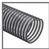
EOLO PU EST