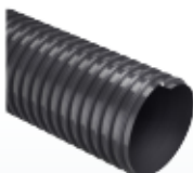
EOLO L (cód. EL) p.41