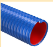
URANO HD SUPER (cod. UH) p. 36