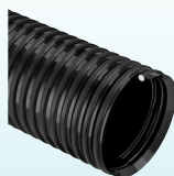
APOLLO SUPERFLEX (cod. AS) p.70

ARTICOLI DELLA STESSA SERIE ITEMS IN THE SAME SERIES