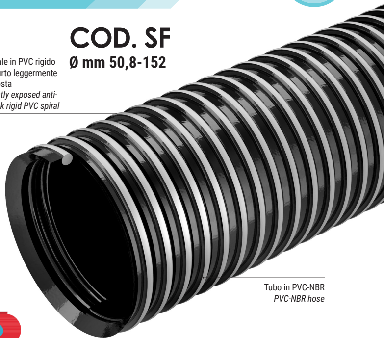
Tubo in PVC-NBR PVC-NBR hose

Spirale in PVC rigido antiurto leggermente esposta Slightly exposed anti-shock rigid PVC spiral