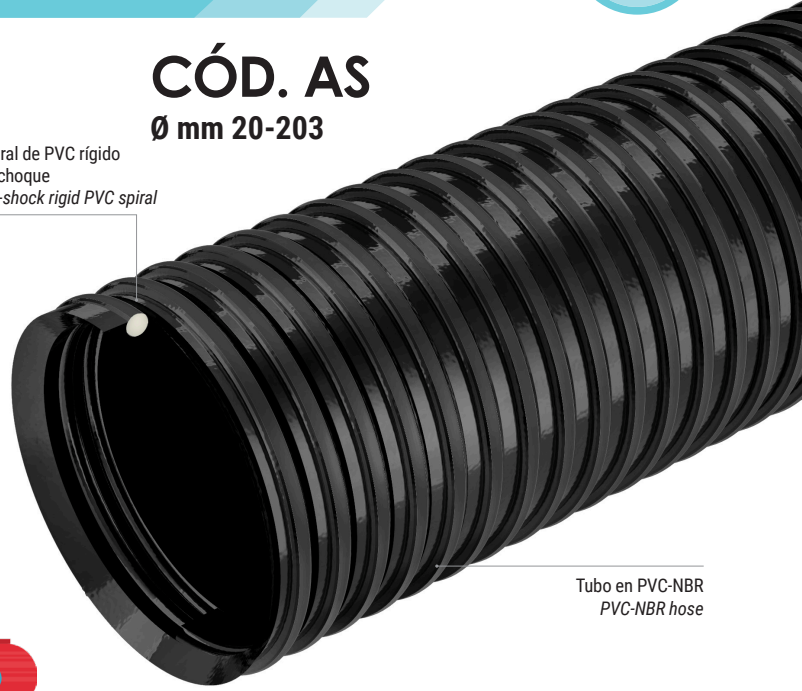
Tubo en PVC-NBR PVC-NBR hose

Espiral de PVC rígido antichoque Anti-shock rigid PVC spiral