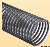
EOLO PUP EST (cod. OP) p.33

*Disponibile su richiesta, per quantitativi da concordare con l'ufficio vendite.