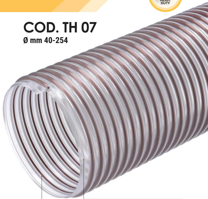
TPU a base de éster antimicrobico Ester based TPU hose