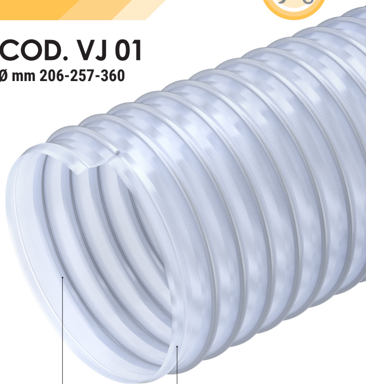
TPU a base estere antimicrobico Antimicrobial ester based TPU