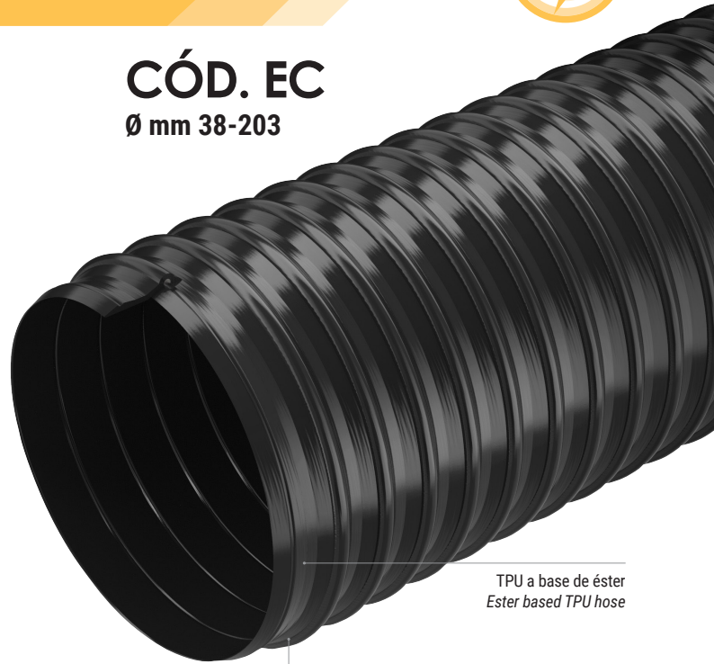
TPU a base de éster Ester based TPU hose