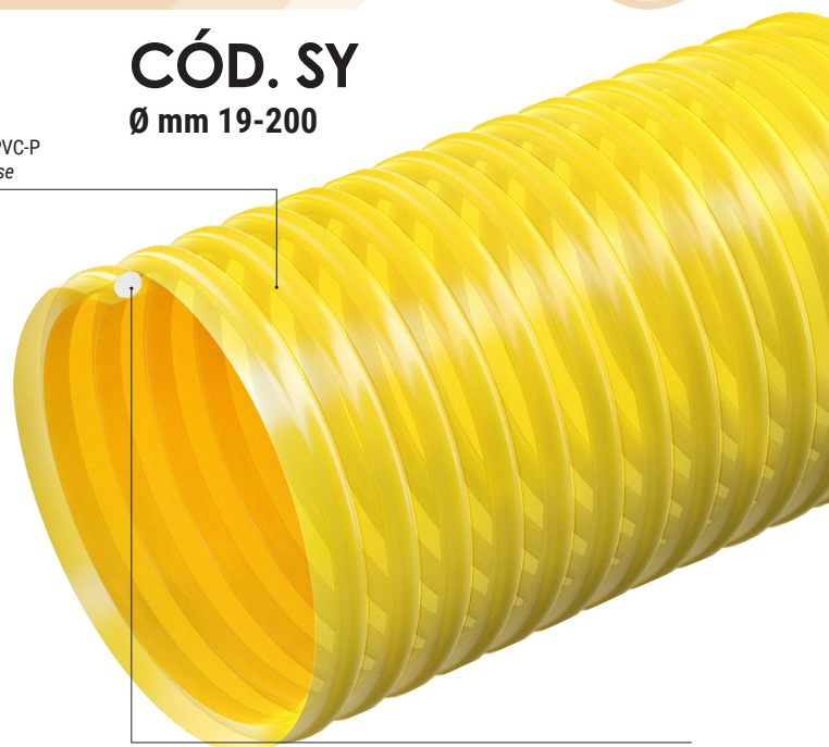
Espiral de PVC rígido antichoques Anti-shock rigid PVC spiral