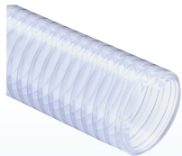
SATURNO IDRO SE (cod. SI 06) p.78