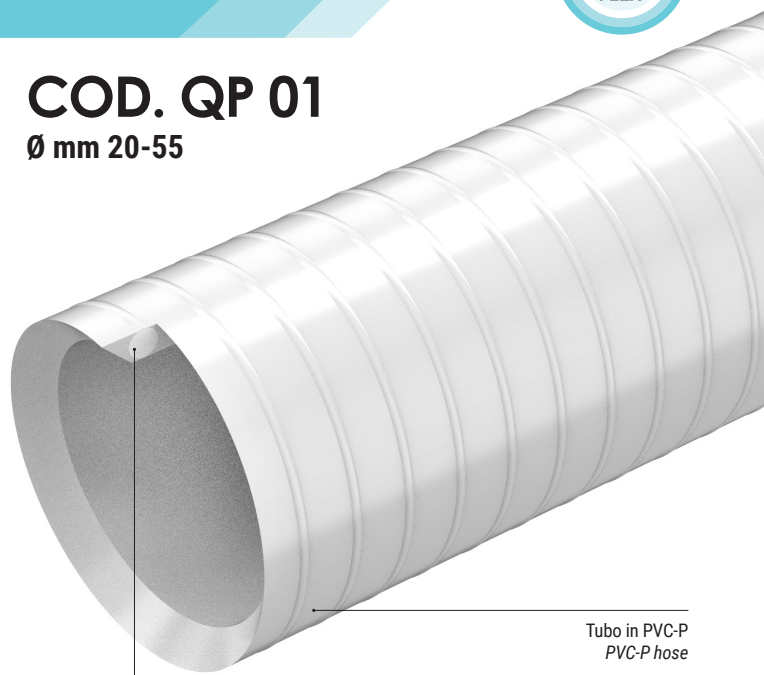
Tubo in PVC-P PVC-P hose