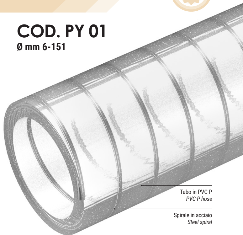
Tubo in PVC-P PVC-P hose