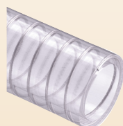
PLUTONE BIO (cod. B2) p. 100