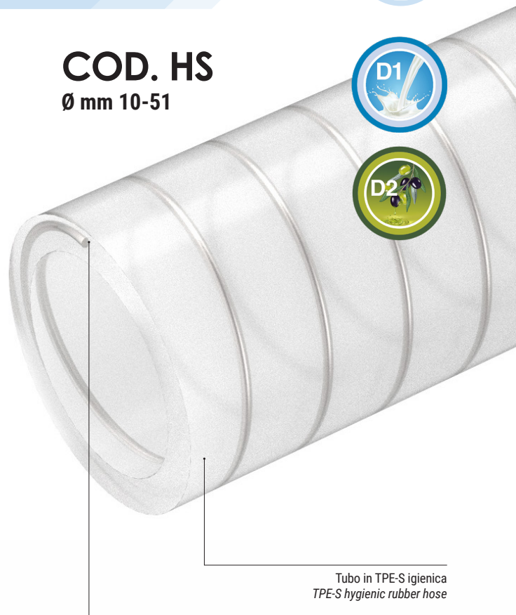
Tubo in TPE-S igienica TPE-S hygienic rubber hose