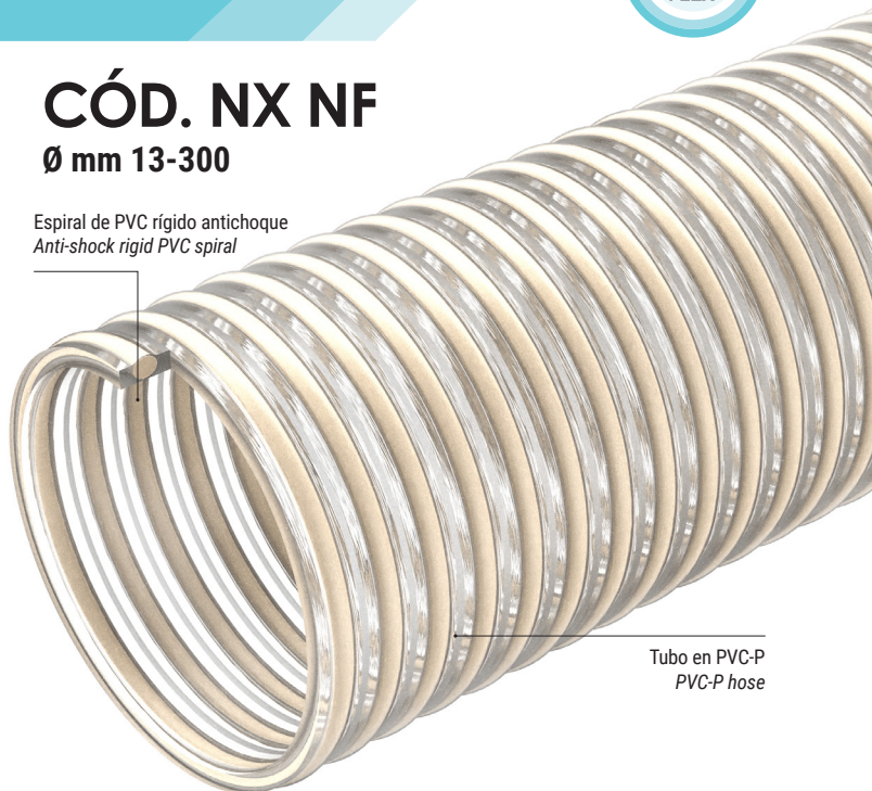
Tubo en PVC-P PVC-P hose

Espiral de PVC rígido antichoque Anti-shock rigid PVC spiral