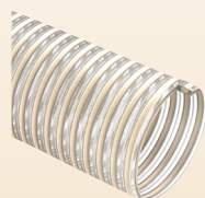
NETTUNO (cód. NQ) p.107

*Disponible bajo pedido, para cantidades a convenir con el departamento de ventas.