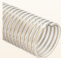
NETTUNO SE (cód. NX NF) p.80

ARTÍCULOS DE LA MISMA SERIE ITEMS IN THE SAME SERIES