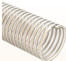
NETTUNO SE (cód. NX NF) p.80