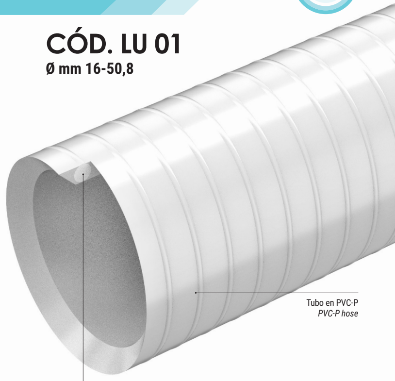
Tubo en PVC-P PVC-P hose