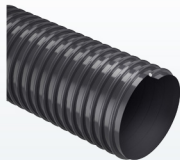
EOLO L (cod. EL) p.41