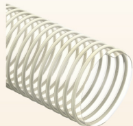
EOLO PU FOOD (cod. EU) p.93