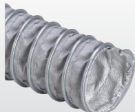
EOLO HT 400 °C (cód. H4) p.50