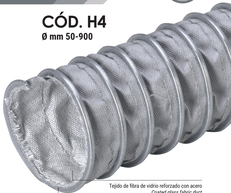
Tejido de fibra de vidrio reforzado con acero Coated glass fabric duct