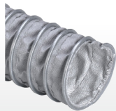
EOLO HT 400°C (cód. H4) p.50