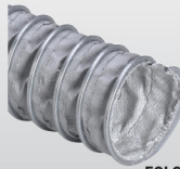
EOLO HT 450 °C (cód. H5) p.51