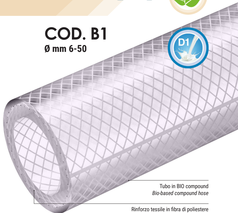
Tubo in BIO compound Bio-based compound hose