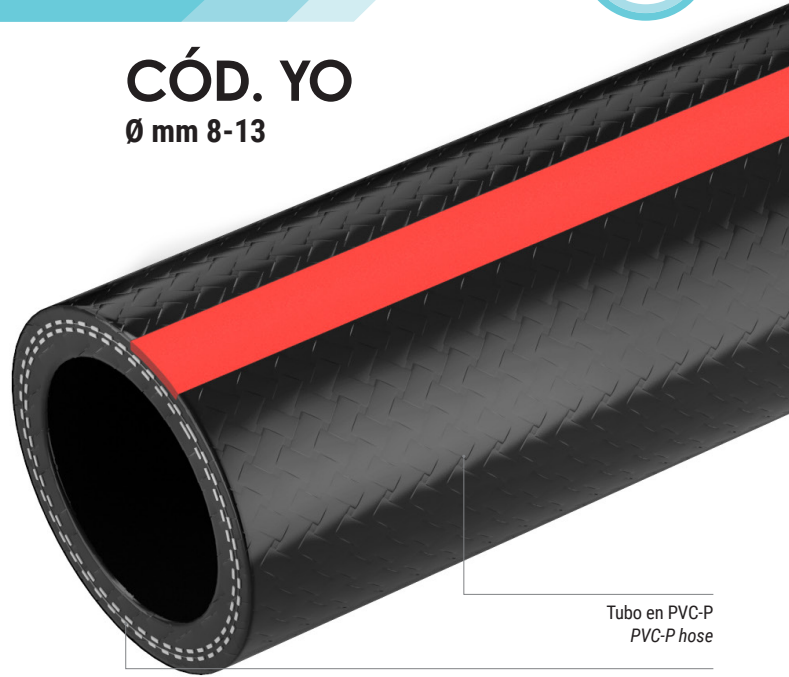
Tubo en PVC-P PVC-P hose