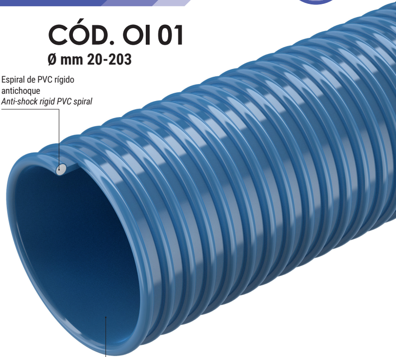
Tubo in PVC-NBR PVC-NBR hose

Espirales de PVC rígido antichoque Anti-shock rigid PVC spiral