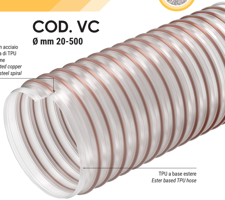
TPU a base estere Ester based TPU hose

Spirale in acciaio ricoperta di TPU color rame TPU coated copper colored steel spiral