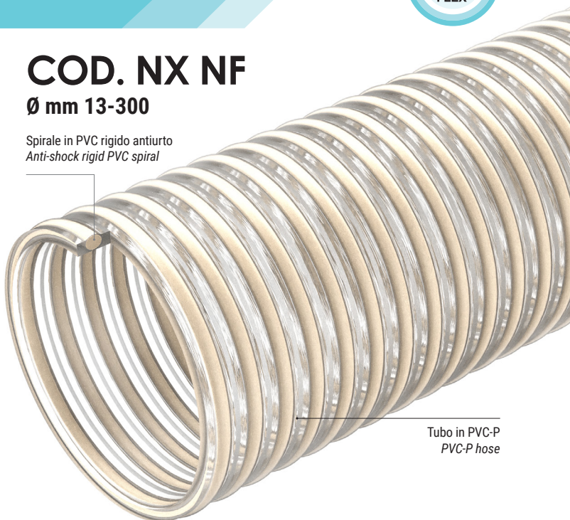
Tubo in PVC-P PVC-P hose

Spirale in PVC rigido antiurto Anti-shock rigid PVC spiral