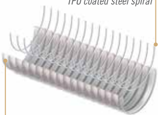
Ether-Basis Polyurethan / Ether based PU

Translucent ether based Polyurethane hose, reinforced with a high adhesion PU coated zinc colored steel spiral. Constant wall thickness of 1,5 mm for the whole diameter range. Smooth inside to optimize flow properties. Resistant to microbes and Hydrolysis; the hose is odourless and doesn't change the organoleptic properties of the transferred materials. It can be made conductive by earthing the steel spiral.