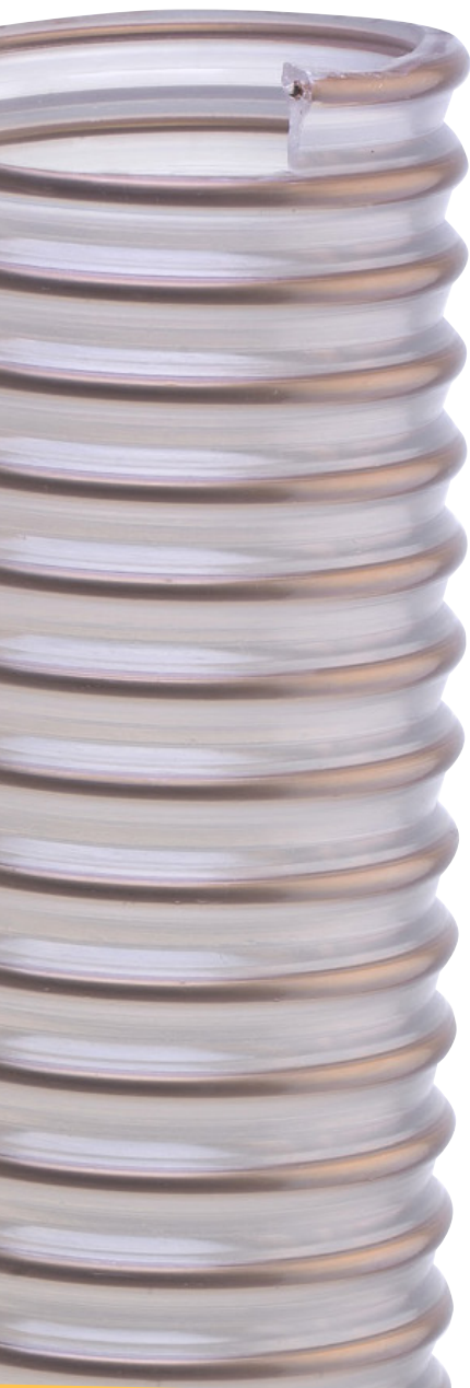
Spirale in acciaio ricoperta di TPU color rame Copper coloured TPU coated steel spiral

• Suction of extremely abrasive media, like quartz sand, waste material in steelworks and particularly indicated for vacuum cleaner trucks. As well as URANO HD SUPER, it represents the best solution in terms of abrasion resistance in the roof rocking sector. Vulcano Stone Plus can be also installed in cement factories and quarries.