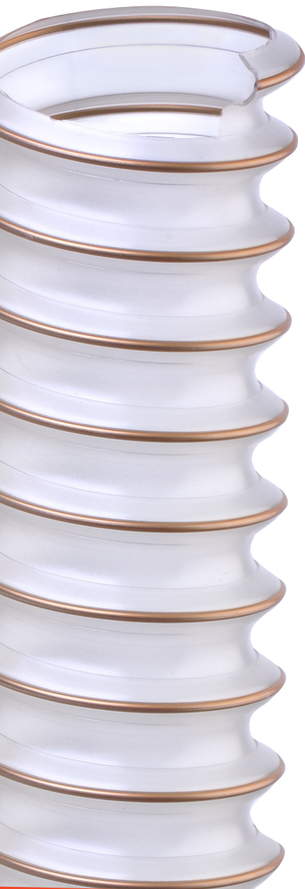
Spirale in acciaio ricoperta in TPU color rame Copper colored TPU coated steel spiral

• Suction of wood shavings and sawdust, in sawmills and woodworking plants; small vacuum cleaning and light suction plants. Used as protection sleeve.