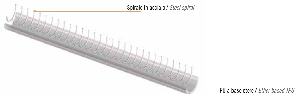
Scheda tecnica / Technical data