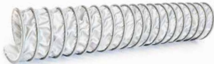
Technische Daten / Technical data