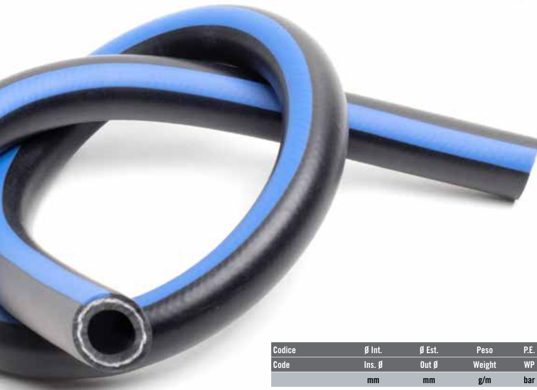
Scheda tecnica / Technical data