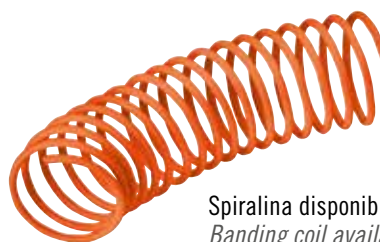
Spiralina disponibile (Cod. SC WT) Banding coil available (Code SC WT)