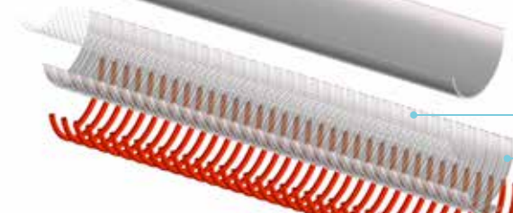
Rinforzo tessile / Textile reinforcement