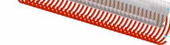
Tubo in PVC-P / Plasticized vinylic compound