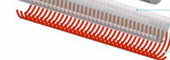
Rinforzo tessile / Textile reinforcement