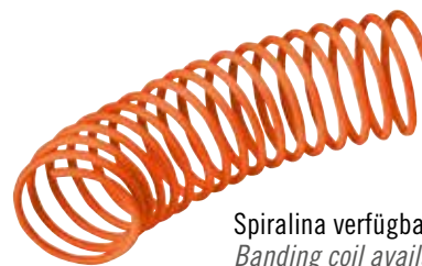
Spiralina verfügbar (Cod. SC WT) Banding coil available (Code SC WT)